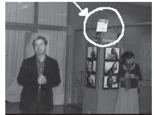
Kontrainformem de la discòrdia